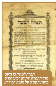
תפלה למשה בו נדפס סדר התפלה שתיקן רבינו חת"ס בשנת תקצ"ב על מגפת הכולירע

לאחר שהבאנו את הקורות בפרעשבורג בתקופת מגיפת הכולירע הידועה בשנת תקצ"א-תקצ"ב, הנה זכתה העיר פרעשבורג, וכבר בחורף תקצ"ב נוקתה העיר מהמגיפה, עם פצירת המגיפה בחסדי שמים, נשא רבינו