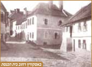
באסקאוויץ רחוב בית הכנסת

כך במשך כל ימי השבעה, עלו ובאו המוני תושבי העיר לנחם את רבם באבלו הכבד, אך באו לנחם ויצאו מנוחמים ומחזקים, בראותם את אותו גאון וקדוש במדרגה העליונה, למעלה מהשגת אנוש, של 'אהבת את ה' אלקיך בכל מאדך - בכל מידה ומידה