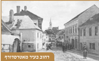
רחוב בעיר מאטרסדורף

עתה, הופנו כל המבטים אל האשם האמיתי: נאמן הקהל - שמש הקהילה. הוא, שקיבל על עצמו את השליחות, מעל בתפקידו. הרי הרב אמר בדרשתו כי שיגר עמו את התנאים לראש הקהל, ואם ראש הקהל לא קיבל את המכבד, משמע הוא נשאר אצלו. אם כן, הוא האחראי לכך שרבים אהובי עוזב אותם.