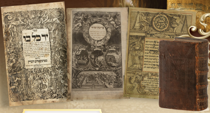
פרשת פנחס תשפ"ה