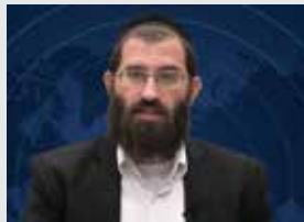
הרב שלמה סטרו שליט"א ספרדית