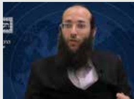
הרב מנחם דרימן שליט"א עברית