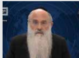
הרב מאיר ערערא שליט"א צרפתית