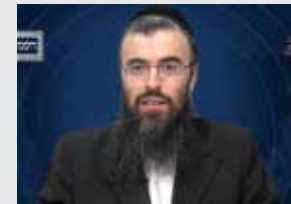
הרב אריה זילברשטיין שליט"א עברית