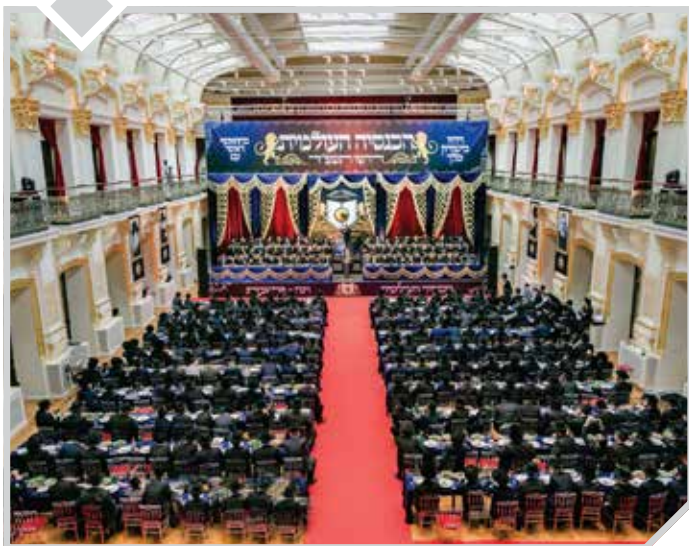
הכנסיה העולמית - יסוד העמוד היומי, יונה תשפ"ד

אליו יחד עם נשיא דרשו, להבחל"ח הרה"ג רבי דוד הופשטטר שליט"א, להתיעצות על ייסודה של תכנית זו" הוא מתאר.