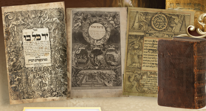
חג השבועות תשפ"ה

פּוּנְיִים גְּדוּרִים מִסְפָּרִים עֵתִיקֵי יוֹמִין