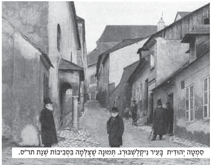
סמטה יהודית בעיר ניקלשבורג. תמונה שצלמה בסביבות שנת תר"ס.

באמצע הדרך, כאשר עצרנו למנוחה קלה, הצרכתי לברך ברכת 'אשר יצר'. בחסדי שמים הזדמן לידי מעין מים שבו יכלתי לרחץ את ידי טרם הברכה. אולם, כאשר פנהגתי מאז ומקדם בקשתי לברך את הברכה לפני העגלון היהודי, כדי שהוא יענה אחרי אמן, הבנתי עד