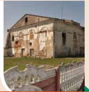
בֵּית הַכְּנֶסֶת בְּעִיר מְקוֹבְרִין שֶׁבְּבִלְאֲרוֹס, כְּפִי שֶׁהוּא נִרְאָה כְּיוֹם

רַבֵּי מֹשֶׁה פְּאֲלִיר מְקוֹבְרִין נוֹלַד בְּשָׁנַת תַּקמ"ד בְּעִיר פִּיֶּסֶק שְׁעַל יַד הָעִיר קוֹבְרִין הַסְּמוּכָה לְבְּרִיֶּסֶק, לְאֲבִיו רַבֵּי יִשְׂרָאֵל אֱלִיעֶזֶר. בְּצַעֲרֹתוֹ לְמַד תּוֹרָה וְאַרְחוֹת חַיִּים מִפִּי רַבֵּי מֹשֶׁה מְשֻׁרָשׁוֹב וּבַהֲמִשָּׁךְ הַחֵל לְהַסְתוֹפֵף בְּצִלוֹ שֶׁל הָאֲדָמוֹר רַבֵּי מְרְדִכֵי מְלִכוּוִיטֵשׁ. לְאַחַר הַסְתַּלְקוֹת רַבּוֹ הַסְתוֹפֵף בְּצֵל בְּנוֹ, הָאֲדָמוֹר רַבֵּי נַח מְלִכוּוִיטֵשׁ.