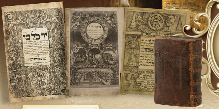
פרשת שמיני תשפ"ה