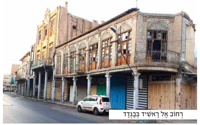
רחוב אל ראשיד בגדד

בני השירה מנסים להניא את הרב מוצפי מלהשאיר באזור הסכנה. "לא תצליח להחליץ מכאן בכחות עצמך", הם משדלים אותו בהגיון. "לא תמצא את פתח המלוט, שליחיו של הצבא הטורקי יתפסו אותך, ומקומך יהיה בעמוד התליה אשר בכפר העיר. לא חבל?"