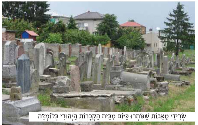
שרידי מצבות שנותרו כיום מבית הקברות היהודי בלומז'ה

בסיום התפלה נשק גבריאל לתפלין, טמן אותן בתרמילו ומהר אף הוא לתחנת הרפכת. בסתר לבו היא קנה שהרפכת האחרונה לא עזבה את התחנה עדין, והוא יוכל להמלט עמה לעמק ברית המועצות.