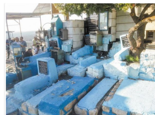
קברו של הרדב"ז שייך לזרם החרדי, ומצבתו נמצאת בקבר השלישי מימין בשורה התחתונה.

מצבת קברו של הרדב"ז בבית החיים בצפת, הקבר השלישי מימין בשורה התחתונה