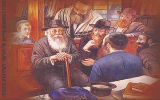
יחיד למסורת קיימת על האישור לפרויקט המבית