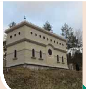
האהל על ציונו של הסבא קדישא מראדושיץ