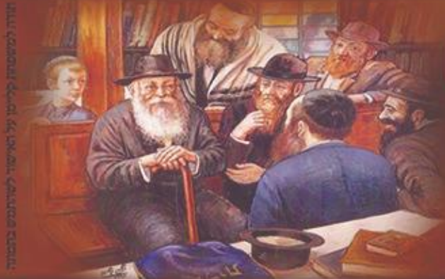
יורה דעה סימן קצ"ד על האיסור ליהנות מברכה