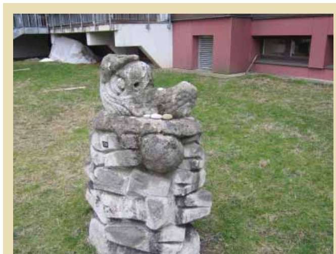
תמונת מצבת הדג בבית העלמין הישן בווינה, סמוך לקברו של רבי שבתי שעפטייל הורוביץ, בעל 'זוי העמודים'.

מעשה יש לפרש שבעל 'זוי העמודים' סבר כדבריו שברכות הלחש נשלמות בעניית אמן אחר חזרת הש"ץ ונחשבות כתפלה אחת, וממילא גם מי שכונן פהלכה בתפלת הלחש, תפלתו תלויה ועומדת בעניית אמן אחר חזרת הש"ץ, ואם לא ענה אמן מאבד אף את תפלת הלחש.