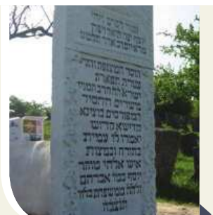
ציון ה'גני יוסף' בסטנוב שבאוקראינה