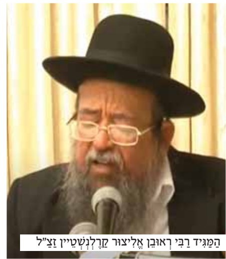
המגיד רבי ראובן אליצור קרלנשטיין זצ"ל

"רגע, זה לא מספיק" - לא ותר ר' הרשל, "אנו צריכים גם לעזר לו להשיג כסף כדי להרחיב, אני כבר עשיתי את שביכולתי, כעת אבקש ממך שתשתדל גם אתה", השכן ההמום הסכים גם לך.