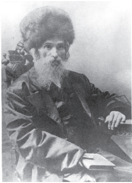
הגאון בעל 'חשק שלמה'

הציץ רבי שלמה בספר, וכנראה שהדברים לא מצאו חן בעיניו, נענה ואמר לו: שיטת הגר"א, כי אם קובעים את המזווה בפתח כשהיא עקומה לא יוצאים ידי חובה, לא של שיטה זו ולא של שיטה זו... (כוונתו, כי בהלכות מזווה יש הסוברים שצריך לקבוע את המזווה כשהיא עומדת, ויש סוברים שצריך שוכבת, והיו שרצו לעשות פשרה ולקבוע את המזווה באלכסון).