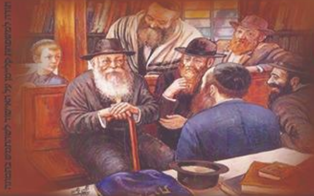
דודו למשפחה לקיים על האישור לפרסום בלבד