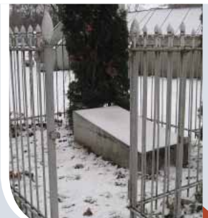
ציונו של רבי ליבער הגדול בברדיצ'ב

רבי אליעזר ליבער נולד לאביו רבי אברהם אשכנזי, שהיה נכדו של רבי שמשון מאוסטרופול. מצד אמו היה נכד של רבי יחיאל מיכל מנמירוב. שני הסבים הגדולים שנמנו עם גדולי המקבלים, נהרגו על קדוש ה' בגזרות ת"ח ות"ט.