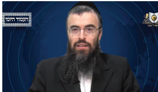
הרב אריה זילברשטיין שליט"א - עברית